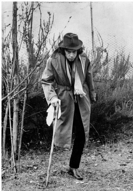
Kuva 2. Andrea Granchi, Il giovane rottame 1972, "Raihnainen nuorukainen", yksi neljän emulsifioidun pohjan sarjasta.

Granchin ilmaisu on kuvan, sanan ja äänen elokuvallista simulaatiota. Se on sukua eurooppalaisen neoavantgarden ja futuristien kuvalliselle runoudelle ( poesia visiva ), jossa teksti ja tekstuuri tai merkki ja ikoni muodostavat synteettisen kokonaisuuden ja antavat uuden ja ennakoimattoman merkityksen ympäröivälle todellisuukselle.