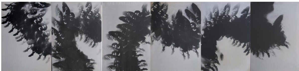
Kuva 1. Andrea Granchi, Svolazzo, 1978, horisontaali sommitelma.

Italialaisen filmitaiteen "Cinema d'Artista" edelläkävijä Andrea Granchi on kasvanut kotikaupunkinsa Firenzen renessanssiaarteiden keskellä ja ammentaa sekä niiden rationaalisuudesta että individuaalisuudesta. Granchin autografiset nykyteokset heijastelevat päivittäisiä tapahtumia tarkkanäköisesti ja välittömästi, menettämättä omaleimaisuuttaan ja sensitiivisyyttään.