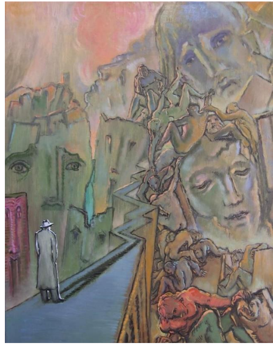
Kuva 3. Andrea Granchi, La città dove le parole si incontrano , 2011. "Kaupunki, jossa sanat kohtaavat", tempera, sovellukset ja öljy kankaalle (200x150).